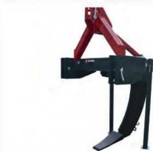
DeepStar 1/80 Ecoline

Opcionális vízvezető kúp csatornák létrehozásához, hogy javuljon a vízfolyás.