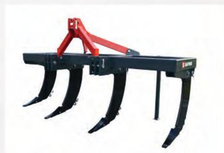
DeepStar 4/80/300 Ecoline