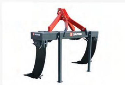
DeepStar 2/80/160 Ecoline